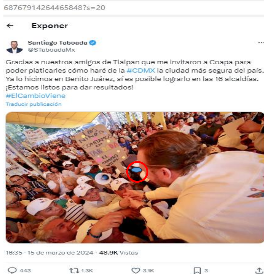
Imagen de la publicación:

De la cual, se constató la existencia de una persona menor de edad (enmarcada para mejor visualización).